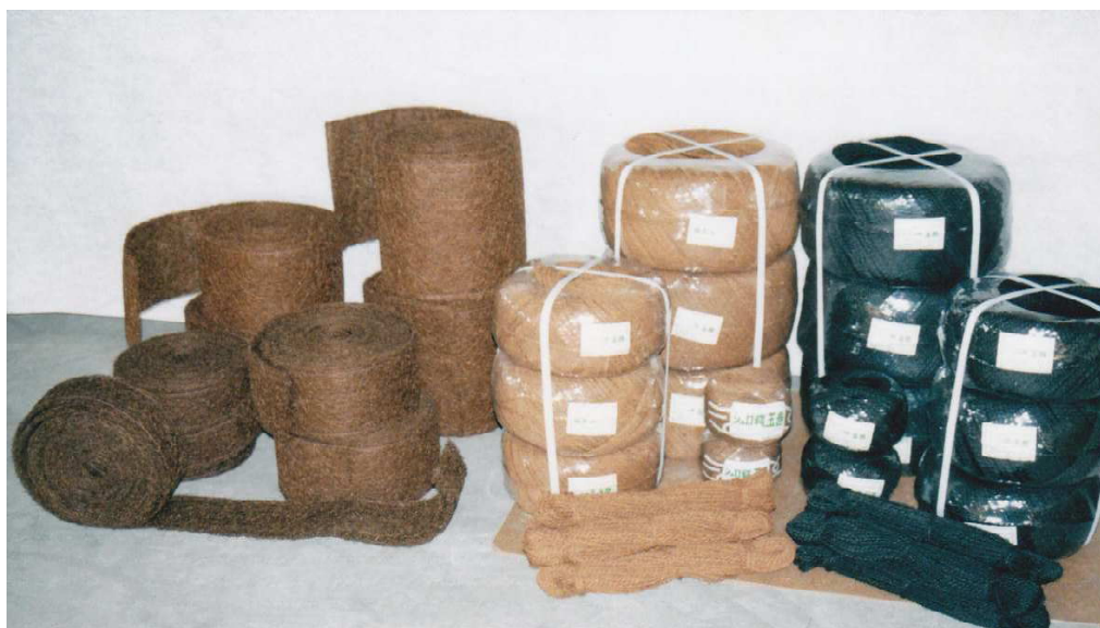
スギテープ(左側)と棕梠なわ(右側)