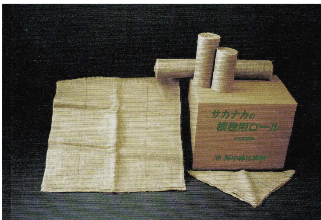
根巻用ジュート布正方形(左)・三角形(右手前)・根巻用ロール(右奥)

※当社の根巻用ジュート布は、上記の規格品以外にも用途に応じたオーダー品も承って居ります。是非とも、お気軽に当社販売部までお申し付け下さい。又、この他に根巻用ジュートバンドもご用意して居ります。