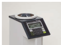
水分値が表示されます。