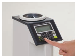
測定する試料の番号を テンキーで入力します。