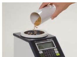
アイコン表示に従い、 試料を注ぎ入れます。※