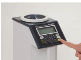
[測定]キーを押します。