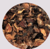
温州ミカン搾り粕