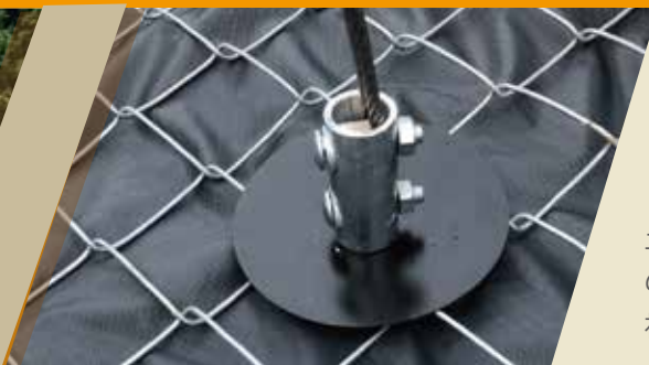
ランドステッチアンカー ベア ルートグラブ（法面固定）仕様

土砂崩れや崩落などを未然に防ぐための雨水浸透防止シートの固定や法面の補強・補修などの保護対策に。大型の重機を必要とせず、人力のみで施工ができ、地盤の状態に合わせてアンカー固定の深さが自由に設定できます。施工後の増し締めも可能です。