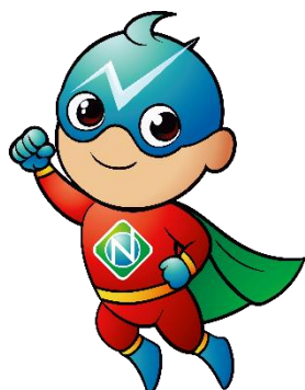
公式マスコット チッピーくん